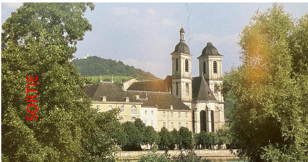
Abbaye des Prémontrés